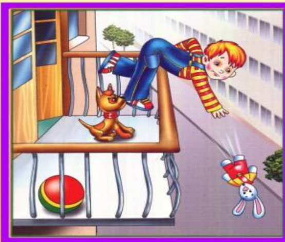
Не играй на балконе, упадешь