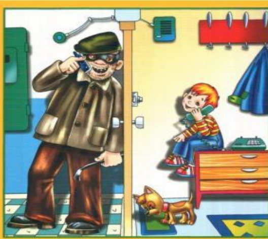
Не разговаривай и не открывай дверь незнакомым людям