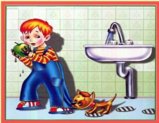
Мойте руки перед едой