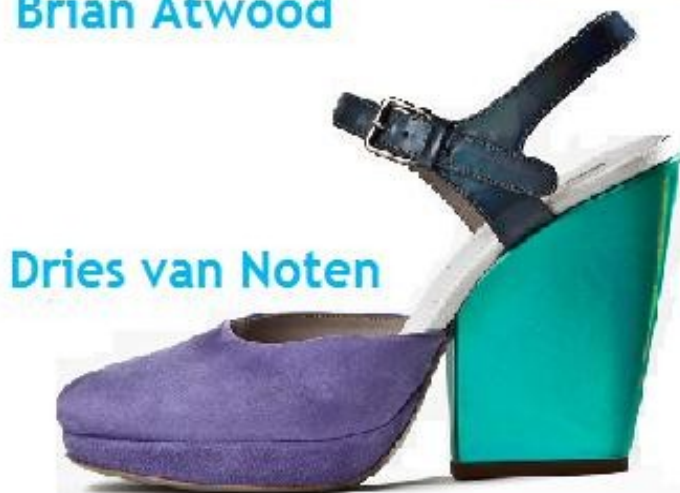
Dries van Noten

В городе продолжает снижаться количество выпускников школ. Резкое падение обозначилось еще в прошлом году, когда к сдаче выпускных экзаменов подошло всего 3200 одиннадцатиклассников. Раньше эта цифра стабильно была около пяти тысяч. В этом году к сдаче ЕГЭ заявлено еще меньше ребят - всего 2993 человека. Аналогичная картина наблюдается и в стане девятиклассников. Если в 2010-м в сдаче ГИА участвовало более восьми тысяч ребят, то в этом году заявлено к выпускным экзаменам 7300 человек. Департамент образования объясняет это демографической ямой девятилетних годов. Число первоклассников постепенно растет, пиковая ситуация в начальной школе ожидается в ближайшие 3-4 года.