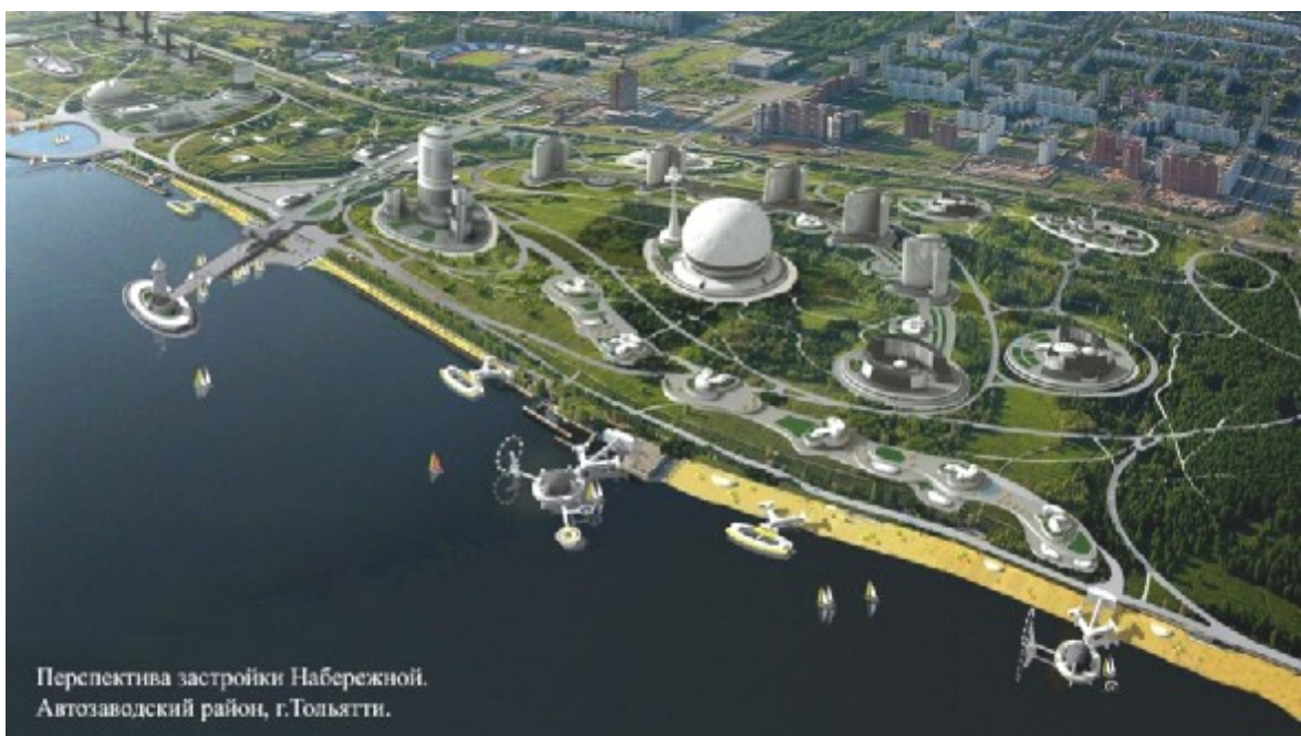
Перспектива застройки Набережной. Автозаводский район, г.Тольятти.

Г.К.: ... сразу ищите продвинутого и богатого спонсора. Все что касается проектов и размещения объектов дизайна или арт-объектов на территории Тольятти, будет проходить экспертную оценку на ЭДС мэрии.