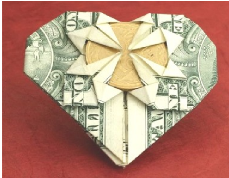
Это как это они?

Продолжаем тему самых странных, нелепых, веселых и необычных валентинок. Над этой страницей, уважаемые читатели, тоже можно поработать ножницами. Только подпишите, что открытка предоставлена нашей газетой!