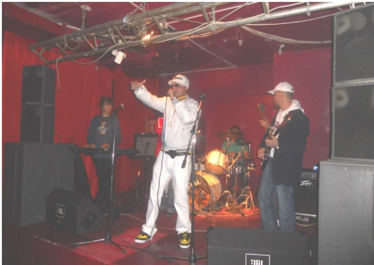
Groovefruit на сцене

1-го октября в обновленном клубе Volta прошел концерт тольяттинских групп Snowflake Jam, Groovefruit и Radio City. Музыканты впервые открыли для себя эту площадку и порадовали публику разнообразием жанров, качеством звучания и оригинальностью своих названий.