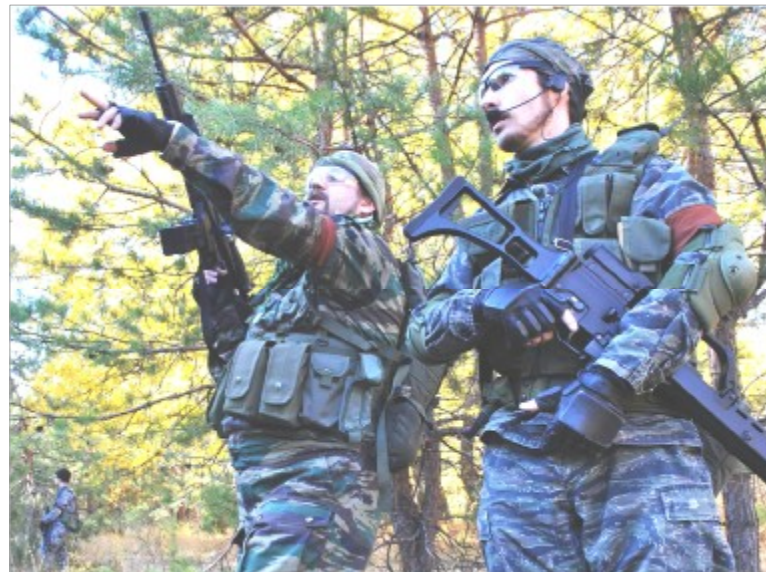
Организаторы страйкбольных игр отмечают, что и зимой самарские леса будут рассекать очереди.