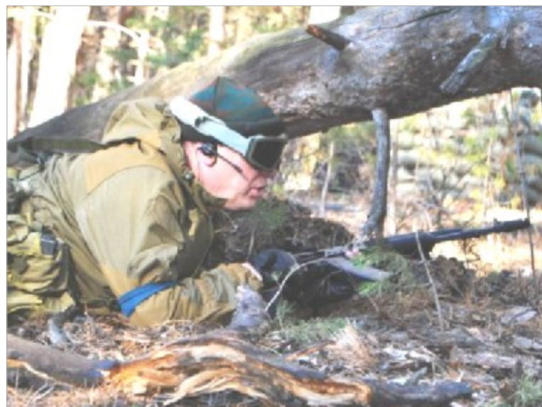
А официально новый сезон стартует в апреле следующего года.