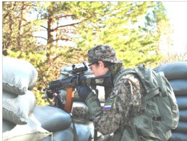
Об укреплениях и окопах игроки позаботились заранее. Базы были оборудованы оборонительными сооружениями всех видов.