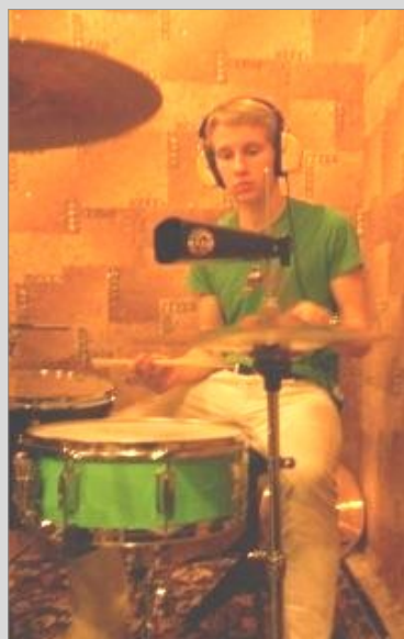
Вы впервые выступаете в «Вольте», а до этого играли только в «Биткоме».