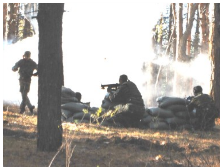
В этот раз задачей игроков был захват и удержание «алмазных шахт». Победителем становилась команда, собравшая наибольшее количество ящиков с «алмазами».