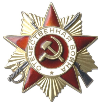
Орден Отечественной Войны