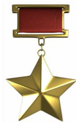
Медаль Звезда Героя