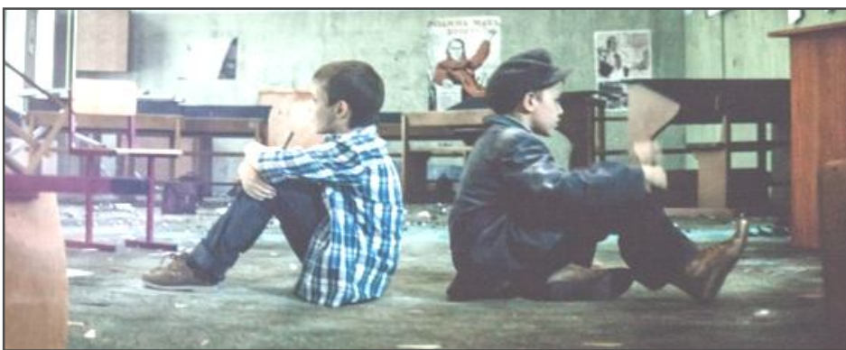
Кадр из короткометражного фильма «Невыученный урок»

Мальчики были заперты в учебных кабинетах. Они общаются через школьную доску, вырисовывая на ней послания друг для друга, которые таинственным об-