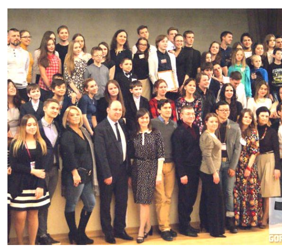
До свидания, «Зазеркалье»!