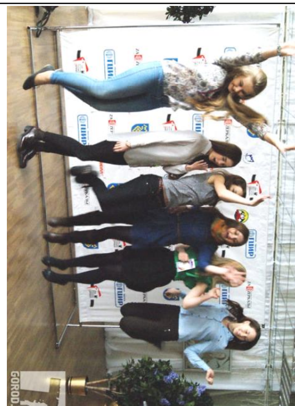
Прыжок в кино