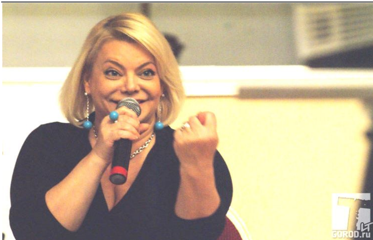
Злой Яны не дождетесь!!!