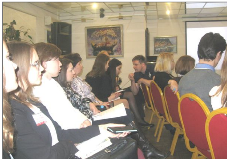
Дискуссия, посвященная вопросам влияния СМИ на психику детей

решена к показу детям с 12-ти лет. Ведущий круглого стола выразил беспокойство тем, какие понятия выработаются у молодого человека после просмотра этой весьма рейтинговой на данном канале программы, в каком ключе он станет восприни-