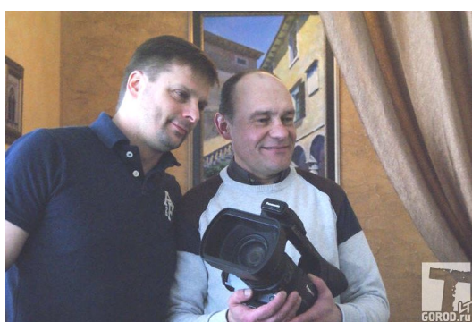
Просто классный кадр