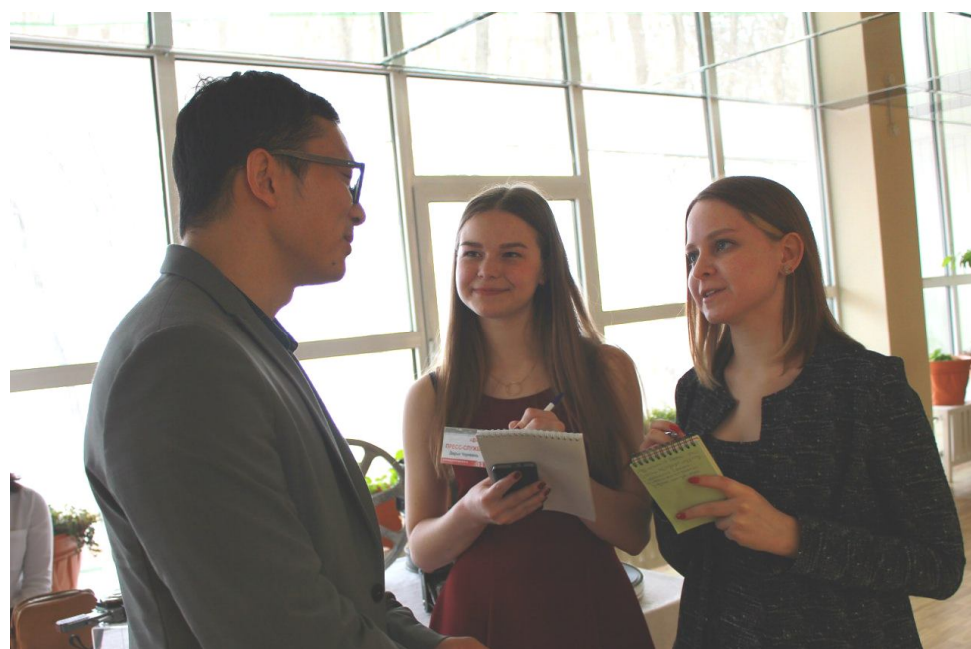
Как мы преодолевали языковой барьер