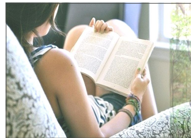
Почитать, послушать, посмотреть

«Эта повесть рассказывает о мальчике, который однажды нашёл на пороге дома коробку со своим именем» - Анастасия ПРОКОПЧУК В ЦЕНТРЕ захватывающей книги.