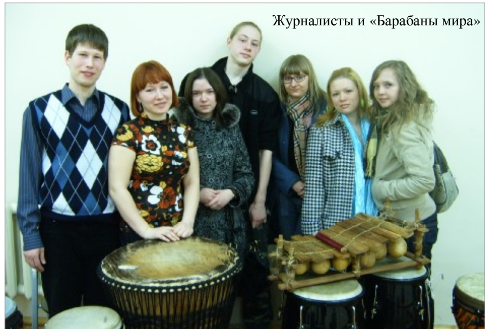
Журналисты и «Барабаны мира»