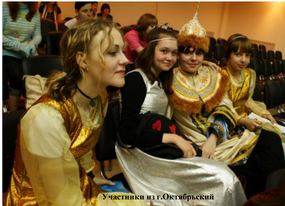
Участники из г.Октябрьский

И это были далеко не последние тёплые слова в адрес сегодняшней молодёжи. С.Б. Цимбаленко прямо заявил: «Не