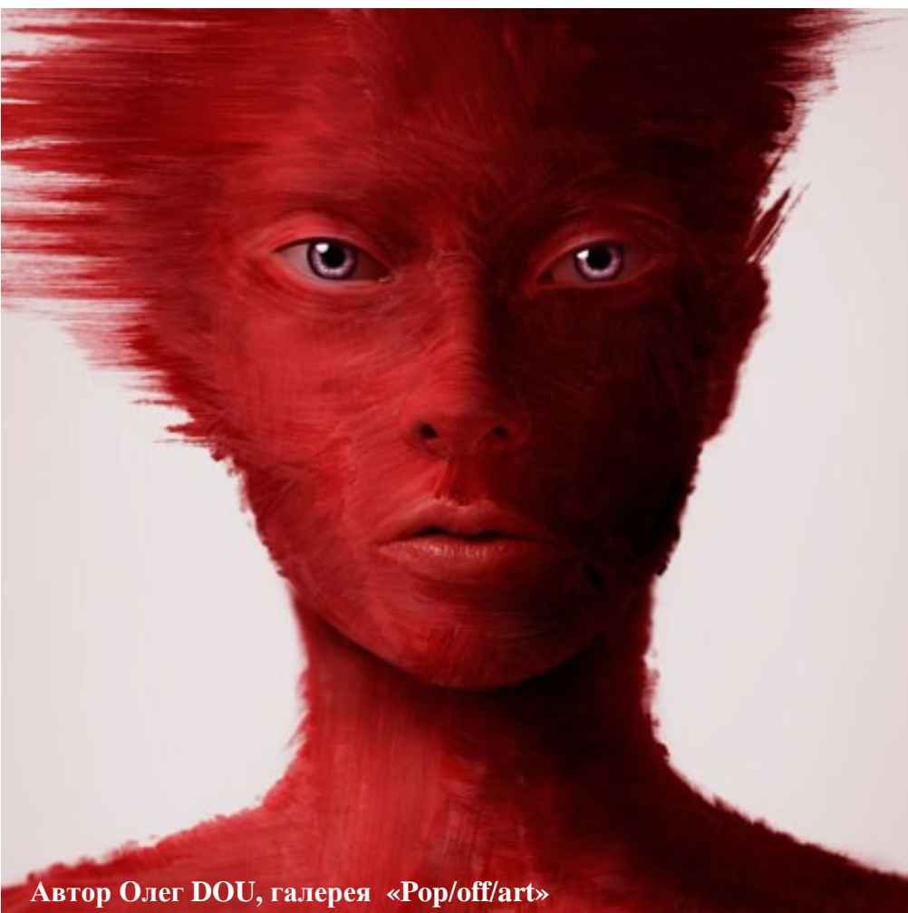
Автор Олег DOU, галерея «Pop/off/art»

ные ящики. Заглянуть внутрь можно через небольшие прорези, неожиданно расположенные чуть ниже или выше среднего роста человека. Именно так, стоя на цыпочках, в лучших традициях детства, можно подсмотреть за жизнью предметов. Потому