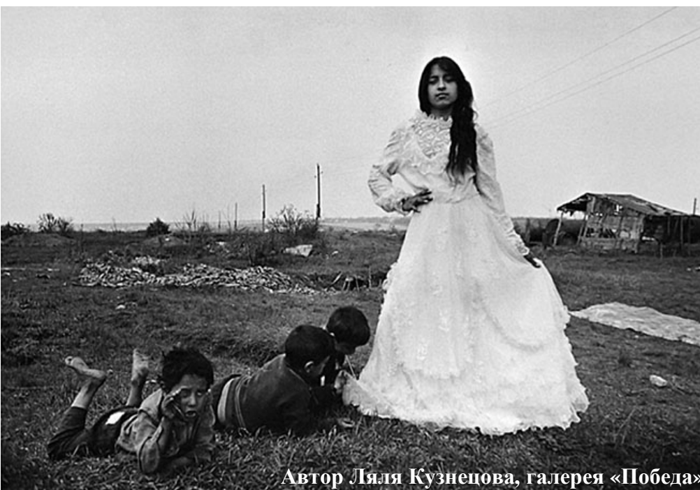
Автор Ляля Кузнецова, галерея «Победа»

Благодаря своему детскому любопытству можно забрести в галерею «Победа», где представлены работы Ляли Кузнецовой. Фотовыставка под названием «Цыгане» позволяет проникнуть в жизнь этого народа, узнать чуть больше и, возможно, преодолеть стереотипы. Цыгане Ляли, пожалуй, бедны с точки зрения жителей больших городов. Да, одежда поношена и кое-где протерлась, предметы быта не отличаются новизной, но богатст-